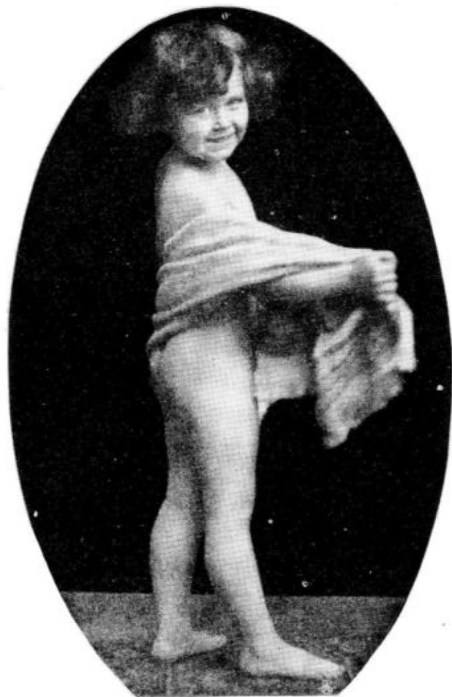
Das schönste Girl immer im Kalyps